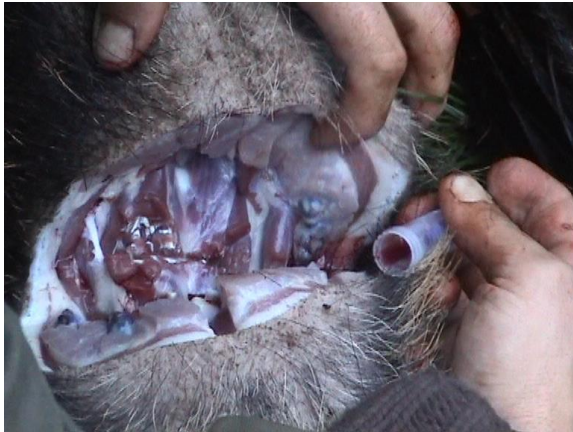
Figure 1. Prélèvement de sang au niveau d'une articulation sur cadavre de sanglier

visant à minimiser le risque d'extension du virus et à favoriser l'immunisation naturelle des animaux, et ii) sur une surveillance virologique et sérologique. Les chasseurs devaient, après les avoir identifiés et avoir prélevé du sang et la rate (Figures 1, 2), déposer les sangliers abattus à la chasse dans des chambres froides dites de « destruction » mises à disposition par les services vétérinaires. L'équarrisseur éliminait les carcasses. La commercialisation était interdite, en contrepartie les chasseurs recevaient une indemnisation de 60 € par sanglier, versée à chacun des locataires par les services vétérinaires.