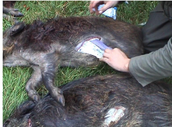
Figure 2. Prélèvement de rate sur cadavre de sanglier