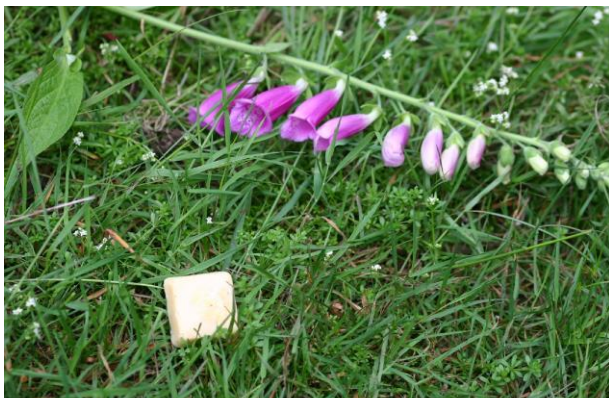
Figure 3. Appâts vaccinaux distribués aux chasseurs