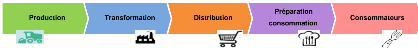
Figure 1. Stades de la chaîne alimentaire concernés par les actions de la Plateforme SCA