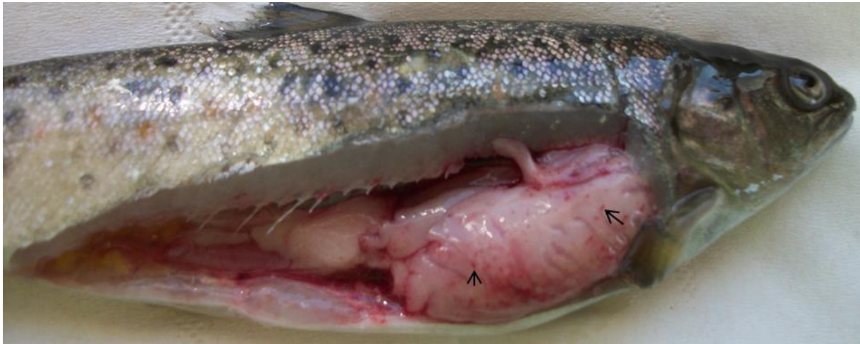
Figure 1. Truite fario avec symptômes de HSMI. Noter les hémorragies sur le tissu graisseux (flèches).