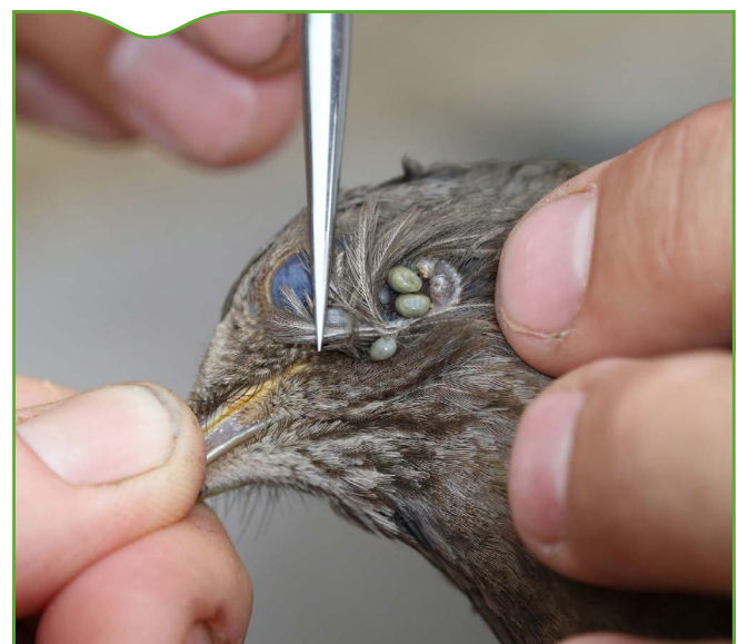
Figure 4. Femelle de merle ( Turdus merula ) infestée par des larves et des nymphes de Hyalomma marginatum

Pour savoir si l'espèce était présente dans d'autres parties du littoral méditerranéen français, zone a priori favorable à son installation (ECDC, 2018), une enquête a été menée en avril-mai 2017, au moment du pic d'activité des adultes, dans tous les départements bordant la Méditerranée, à l'exception des Bouches-du-Rhône pour lesquelles des données préexistaient. Le cheval ayant été identifié en Corse comme l'hôte préférentiel des adultes de H. marginatum (Grech-Angelini et al., 2016), il a été décidé de se concentrer sur cet hôte-sentinel. Les propriétaires de centres hippiques, de chevaux de randonnée,