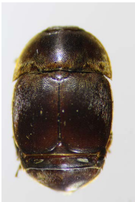
Figure 3. Aethina tumida , forme adulte ; longueur : 6-7 mm