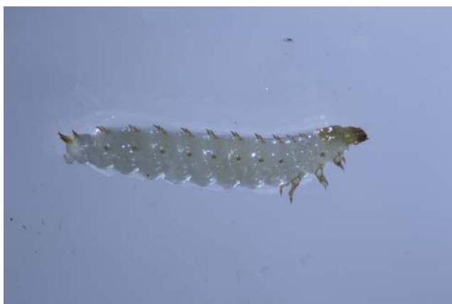
Figure 2. Larve d' Aethina tumida mise en évidence le 5 septembre dans le premier foyer découvert ; longueur : environ 1cm