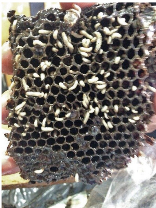
Figure 1. Morceau de couvain infesté de larves d' Aethina tumida , provenant d'un des nuclei présent dans le premier foyer. Un nucléus est une petite colonie d'abeilles de quelques milliers d'individus contenus généralement dans une ruchette. Le cliché a été pris le 5 septembre 2014